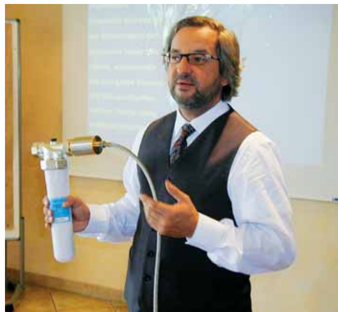
▲ Das Unternehmen auf einen Blick