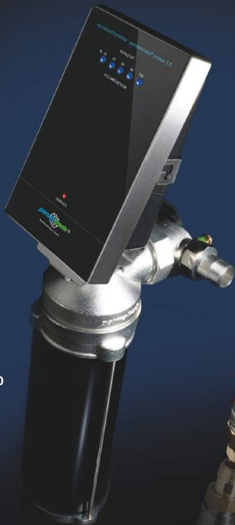
permasolvent® primus 2.0