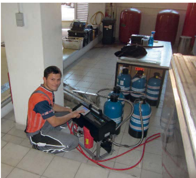
Bild 5 • permaLine lässt sich mit wenigen Handgriffen einfach und sicher ins Heizsystem einbinden und arbeitet anschließend selbstständig weiter.