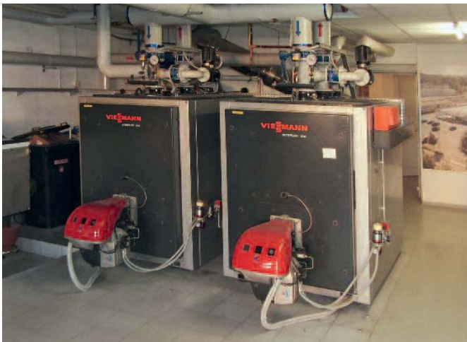
Bild 4 • Ergänzend zum Blockheizkraftwerk gibt es zudem zwei Öl-Heizkessel mit jeweils 600 KW.