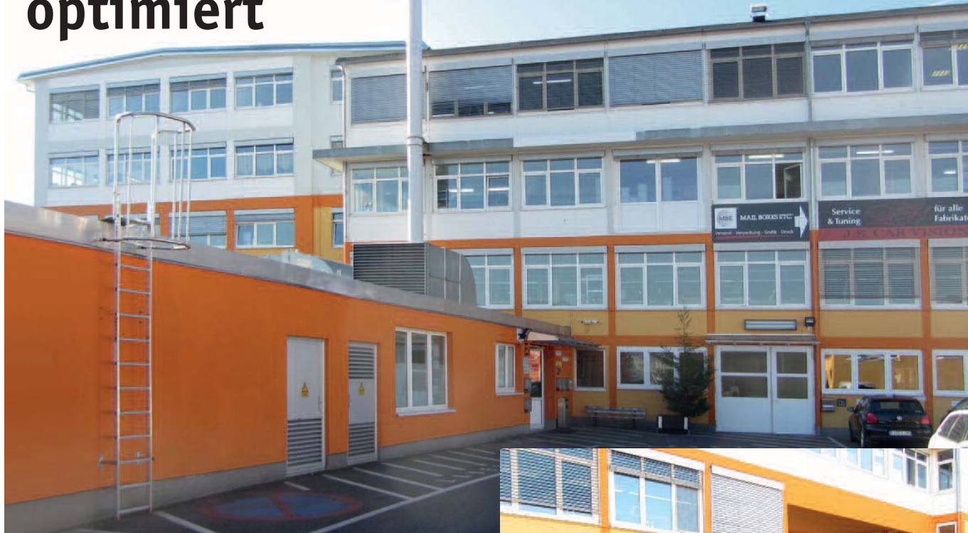
Bild 1 • Rund 40 Firmen sind auf den 15.000 qm des weit verzweigten Gewerbeparks Stuttgart-Denkendorf in mehreren Gebäudekomplexen zusammengefasst.

Um eine optimale Energieeffizienz und den reibungslosen Betrieb der Heizungsanlage im Gewerbepark Stuttgart-Denkendorf zu sichern, stand die Rudi Schlittenhardt GmbH vor der Aufgabe, 15.000 Liter Heizungswasser nach der VDI-Richtlinie 2035 aufzubereiten. Dank der In-line-Entsalzungsmethode permaLine ließ sich das Großprojekt mit relativ geringem Aufwand im laufenden Betrieb einfach und schnell umsetzen.