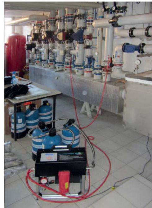
Bilder 6 + 7 • Insgesamt 3 Stück permasoft PT-PS21000IL wurden – in Reihe geschaltet – an den Heizungsverteiler angeschlossen.

sächlich zeigte der Heizungswassercheck im Gewerbepark Stuttgart, dass die Resthärte des bestehenden Heizungswassers mit 5 ° dH nicht VDI-konform war und somit Handlungsbedarf bestand, um den reibungslosen Anlagenbetrieb und Bestandsschutz langfristig weiter garantieren zu können.