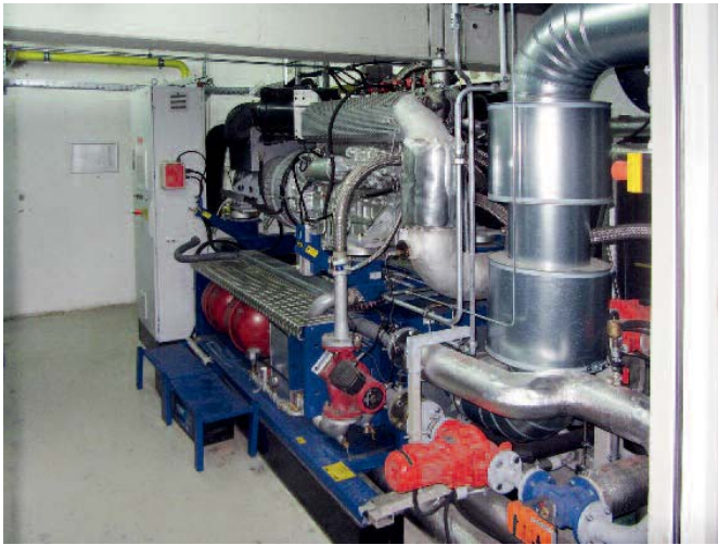
Bild 3 • Die verschiedenen Gebäudekomplexe des Gewerbeparks werden alle von einer Heizungszentrale aus versorgt. Mit einer thermischen Leistung von 275 KW und einer elektrischen Leistung von 201 KW übernimmt ein Blockheizkraftwerk dabei den Löwenanteil der Gesamtleistung. Es wird über einen Gasmotor mit Erdgas betrieben.