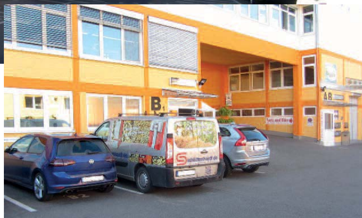
Bild 2 • Die Rudi Schlittenhardt GmbH wurde mit der Aufbereitung des Heizungsfüllwassers beauftragt.

In unmittelbarer Nähe zur Autobahn A 8, dem Flughafen Stuttgart und der Messe gelegen, bietet der Gewerbepark Denkendorf-Mitte auf einer Fläche von 15.000 Quadratmetern rund 40 Firmen aus Industrie, Einzelhandel und Gewerbe viel Raum zur Entfaltung optimaler Geschäftsbedingungen. Das Gelände verfügt über eine eigene Infrastruktur – von der Bäckerei über den Lebensmittel-Supermarkt mit Getränkehalle und die Poststation bis hin zur Autowerkstatt. Dabei werden die verschiedenen Gebäudekomplexe auf dem Gelände alle von einer Heizungszentrale aus versorgt. Diese besteht aus zwei Öl-Heizkesseln mit jeweils 600 KW sowie einem Blockheizkraftwerk, das über einen Gasmotor mit Erdgas betrieben wird. Mit einer thermischen Leistung von 275 KW und einer elektrischen Leistung von 201 KW übernimmt das Blockheizkraftwerk gut 80 % der Gesamtleistung für den Gewerbepark. Dabei speist es wahlweise einen Pufferspei-