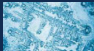
Stadtwasser ohne Behandlung